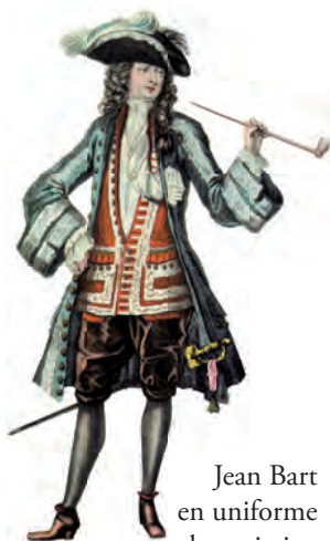
Jean Bart en uniforme de capitaine de Vaisseau

Les 19 dessins inédits de Pierre Ozanne (30 x 24 cm), le plan de dunkerque de 1717 en couleur (30 x 42 cm), et la lettre d'anoblissement de Jean Bart de 1694 en couleur (30 x 42 cm), pouvant être encadrés.