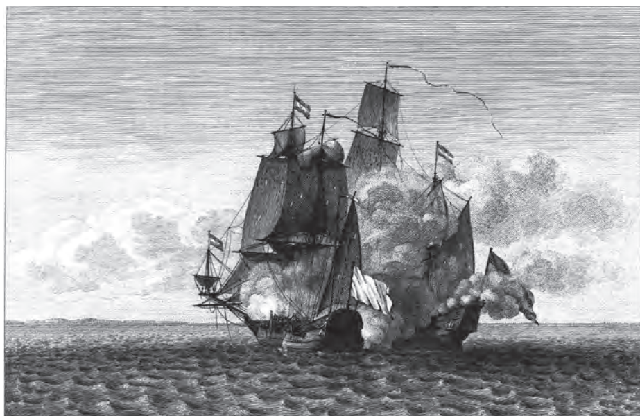
Gravé par Y. Le Gouaz.

Les combats de Jean Bart, première édition des 19 dessins originaux de Pierre Ozanne, lavis gris, mine de plomb, plume et encre brune, retrouvés au Cabinet des Dessins du Louvre et première réédition des gravures de Y. Le Gouaz avec texte de l'ouvrage de 1806.